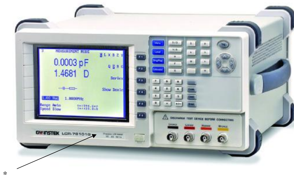
Схема пломбировки от несанкционированного доступа приведена на рисунке 2.

Внешний вид измерителя и место нанесения знака утверждения типа средства измерений приведены на рисунке 1.