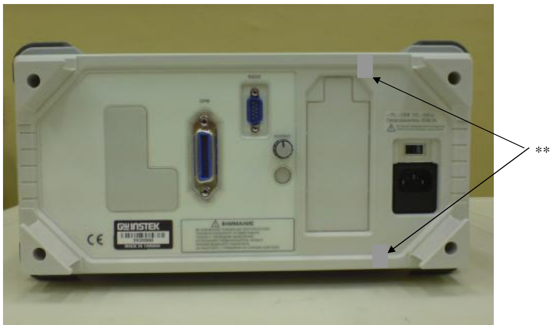
** - места пломбировки (нанесения наклеек) от несанкционированного доступа